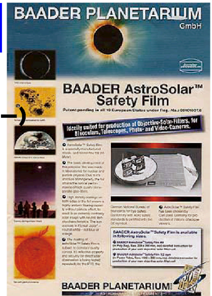
アストロソーラー (20×29cm/1枚)

アストロソーラーフィルムには寿命があります。光学面に劣化や変化が生じている場合は新しいものと交換してください。また、使用前点検を必ず実施し安全確認をしてから使用してください。