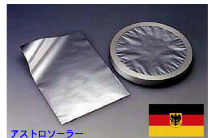
アストロソーラー