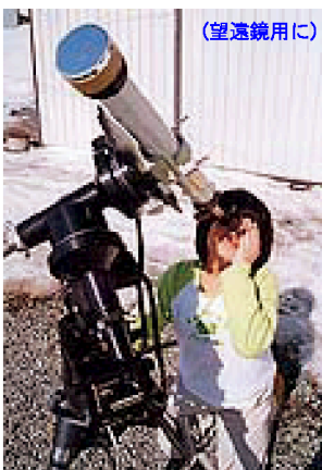
(望遠鏡用に) アストロソーラー (双眼鏡用に)

SEV-ND5/SVAS : www.kokusai-kohki.com/products/SEV.html